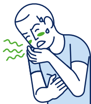
Vertiges / Nausées