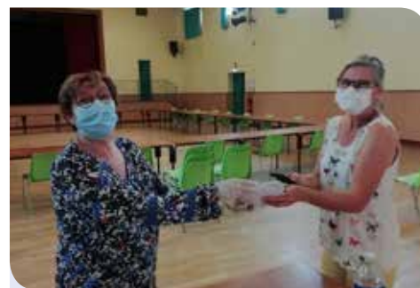
... et distribution par les élus