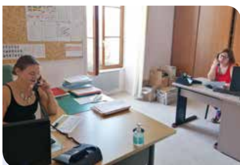
« Phoning » hebdomadaire aux personnes âgées et/ou vulnérables