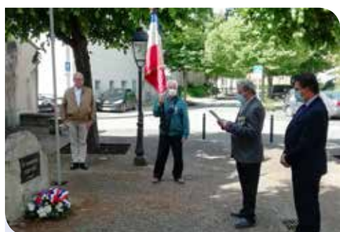
Une cérémonie du 8 mai célébrée en comité restreint