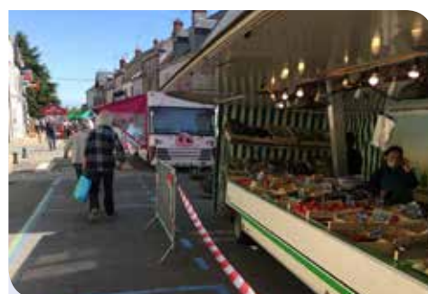
Maintien du marché dominical, avec une nouvelle organisation