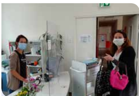
Expérimentation du « BiblioDrive »