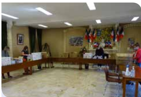
Masques : Préparation par le service administratif...