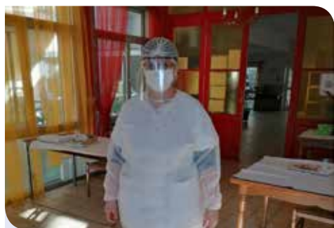
Le personnel de la Maison de Retraite, en 1ère ligne

Durant l'état d'urgence sanitaire, en plein confinement et en phase de déconfinement, la Commune de Toury s'est elle-aussi mobilisée. Dans un contexte peu évident, l'investissement concret des élus et services municipaux.