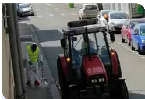
Mobilisation renforcée des services techniques et entretien des bâtiments